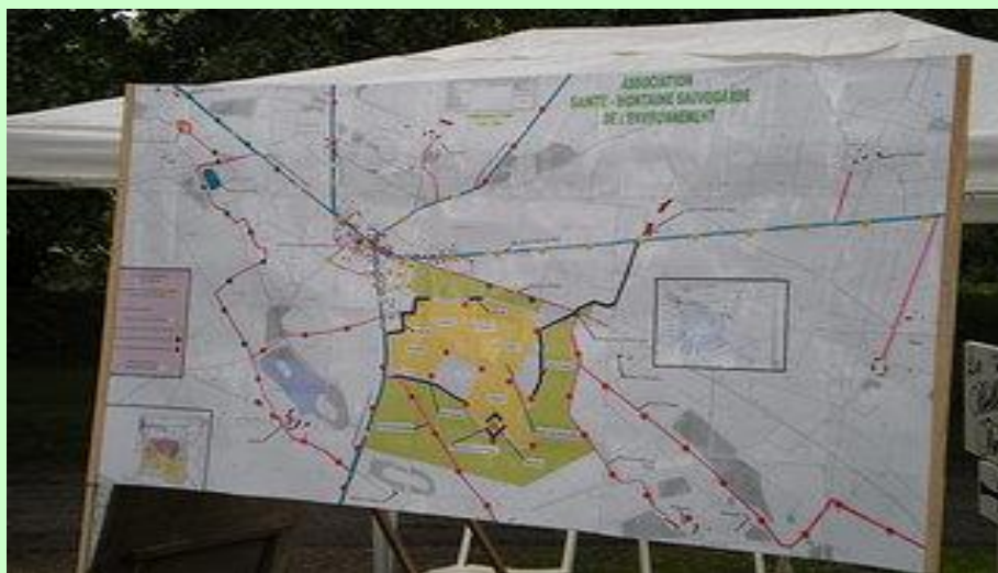
Projet de carrière